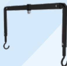
Roterend hijsjuk met haken