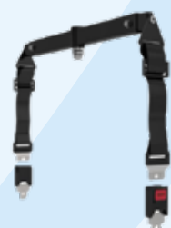
Roterend hijsjuk met veiligheidssluitingen, beschikbaar met 2 of 4 sluitingen