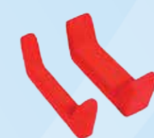
Zitverlenging 5 en 10 cm lang