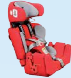
... insteekbare vlakke zit- en rugverlenging 5 cm: zitdiepte 30 cm