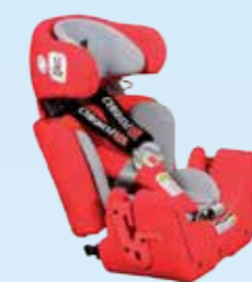
... standaard zitverkleiners: zitdiepte 25 cm