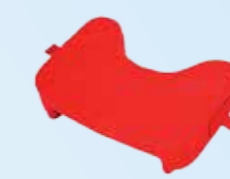
Afneembaar gepolsterd werkblad