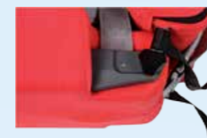
... standaard zitdiepteverstelling 3,5 cm zonder zitverkleiners: zitdiepte 28,5 cm