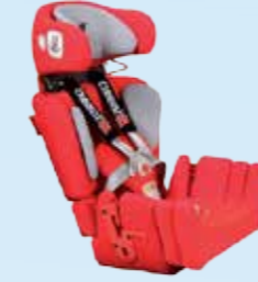
... insteekbare vlakke zitverlenging 5 cm, zitverlenging 5 cm plus rugverlenging 10 cm: zitdiepte 35 cm