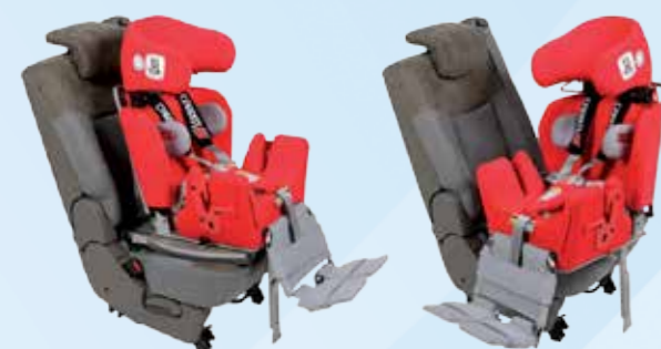
Voetsteunen gemonteerd aan Carrot 3

De draaiplaat is zo ontwikkeld dat de rugleuning verstelbaar blijft. De voetsteunen kunnen mee naar buiten draaien, maar d.m.v. een speciale bevestiging is het ook mogelijk dat de voetsteunen aan de draaiplaat gemonteerd worden. Zo draaien de voetsteunen niet mee.