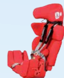
... insteekbare vlakke zitverlenging 5 cm en rugverlenging 5 cm: zitdiepte 33,5 cm