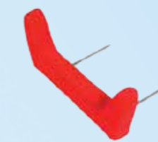
Insteekbare, vlakke zitverlenging, 5 cm lang