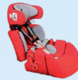
... insteekbare, aflopende zitverlenging: zitdiepte 45 cm