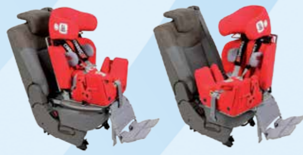
Voetsteunen gemonteerd onder de draaiplaat