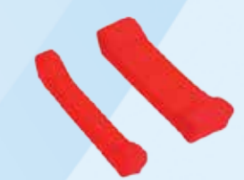
Rugverlenging 5 en 10 cm hoog