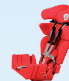
... insteekbare vlakke zitverlenging 5 cm, zitverlenging 5 cm plus rugverlenging 10 cm: zitdiepte 38,5 cm