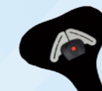
Afdekkapje t.b.v. veiligheidssluiting