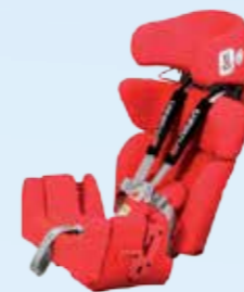
... insteekbare vlakke zitverlenging 5 cm: zitdiepte 33,5 cm