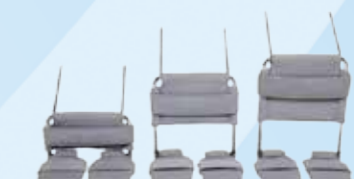
In hoogte instelbaar en draaibare voetsteunen, met fixaties