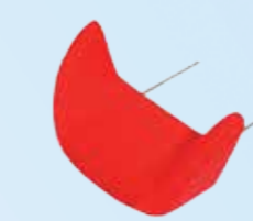
Insteekbare, aflopende zitverlenging, 18 cm lang