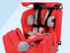
Carrot 3 met zijpelotten en abductieklos